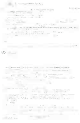
Richiesta collaborazione pag 2.jpg 433 KB