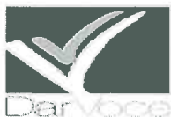
image001.png 2 KB

Informativa Privacy - Ai sensi del D. Lgs n. 196/2003 (Codice Privacy) si precisa che le informazioni contenute in questo messaggio sono riservate e ad uso esclusivo del destinatario. Qualora il messaggio in parola Le fosse pervenuto per errore, La preghiamo di eliminarlo senza copiarlo e di non inoltrarlo a terzi, dandocene gentilmente comunicazione. Grazie.