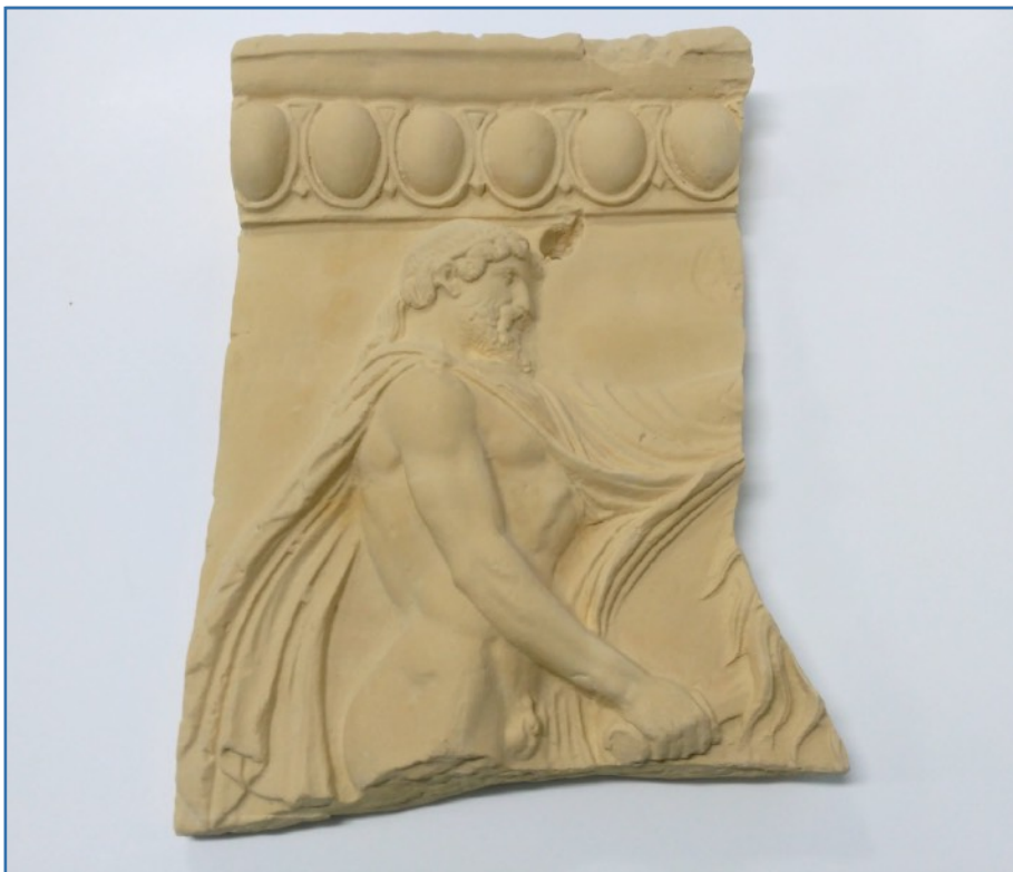
Esempio di riproduzione di lastra in terracotta, realizzata in impasto ceramico opportunamente colorato con l'aggiunta di pigmenti naturali.