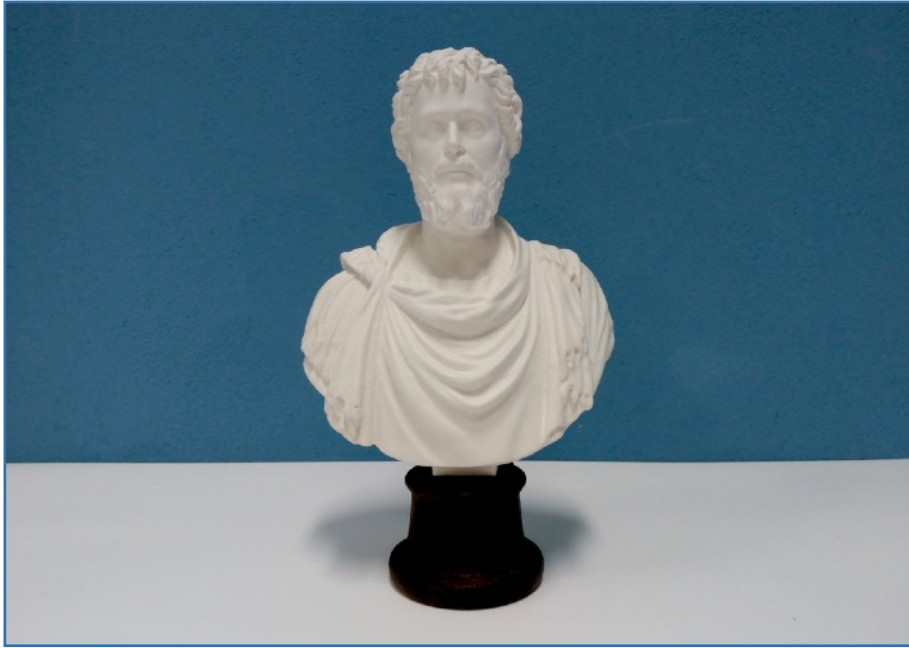
Esempio di riproduzione di busto in marmo, realizzata in gesso bianco con finitura lucida per effetto marmo bianco.