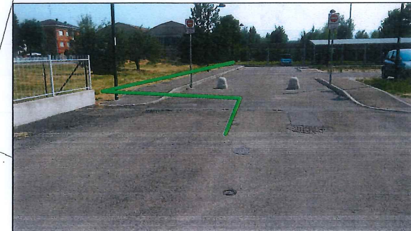
PUNTO DI VISTA A