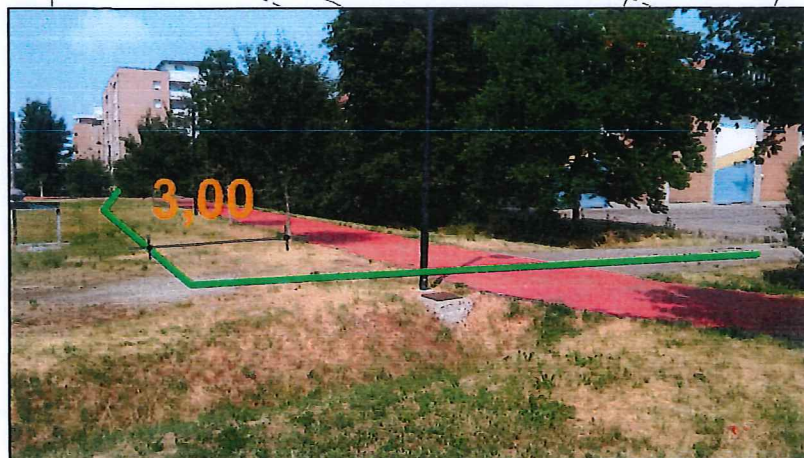
PUNTO DI VISTA H-G