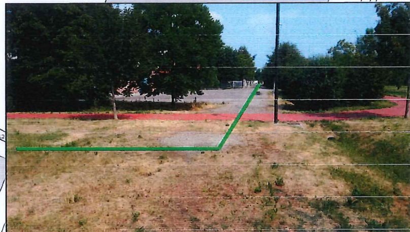
PUNTO DI VISTA H-N