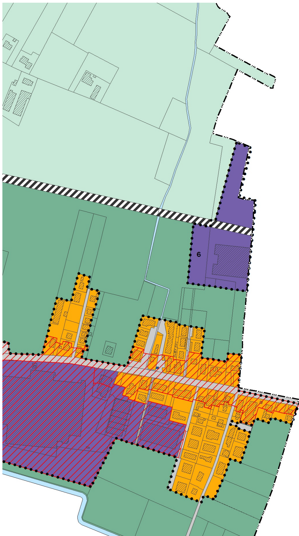
Estratto RUE -R3.2 - disciplina urbanistico-edilizia frazioni e forese - fg. 248