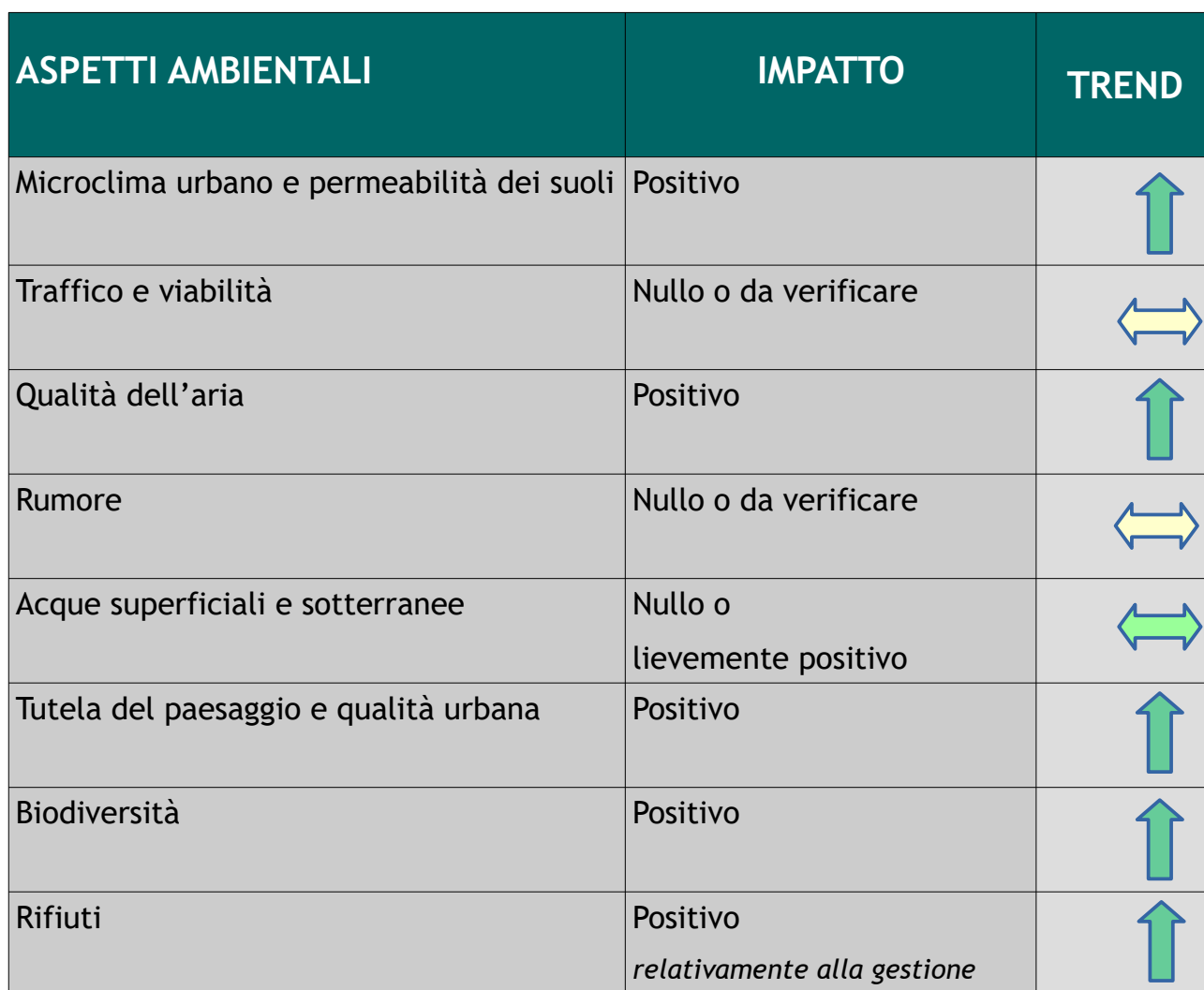
Tab.6 Valutazione sintetica degli impatti potenziali della Variante