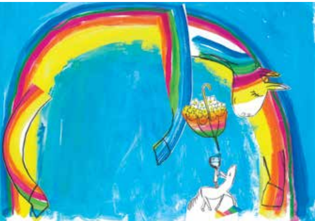
in copertina illustrazione di Vittoria Facchini - Fenomenale - Lapis edizioni

Ci lasceremo incantare dal valore più profondo delle parole, dall'armonia delle rime, dalle emozioni che animano le storie, dalle narrazioni cromatiche delle immagini, dalla forza rivoluzionaria della letteratura per ragazzi che parla a tutti, al di sopra di ogni pregiudizio e stereotipo.