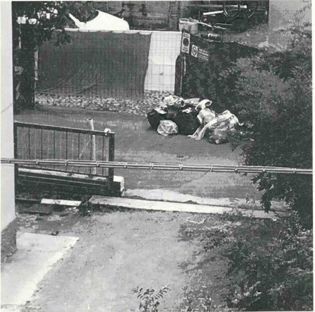
Via Benadir Quartiere Santa Croce