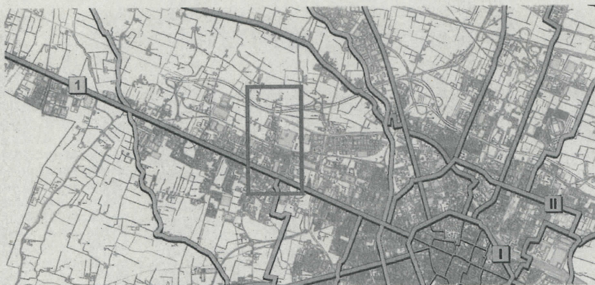
Estratto di BiciPlan 2008

Il BiciPlan 2008 non prevede la realizzazione di infrastrutture dedicate alla ciclabilità, né come rete primaria-ciclovie- né come rete secondaria di supporto; nella revisione BP, in atto, la situazione riguardo al comparto è immutata.