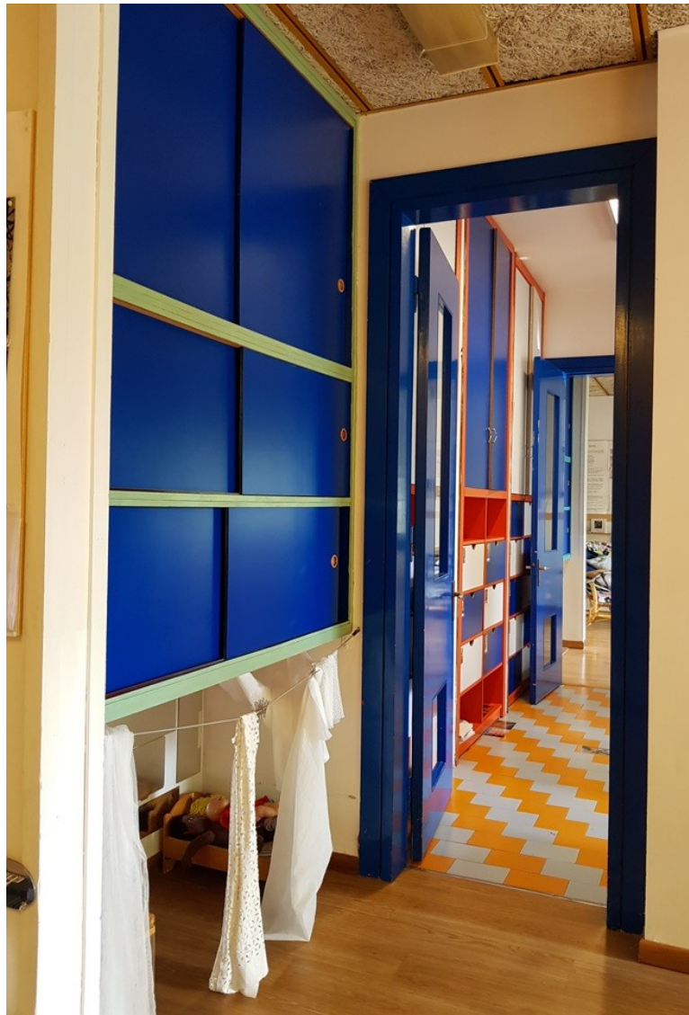
Armadi sezioni adiacenti ai bagni