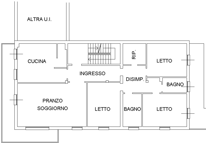
PIANO PRIMO H = mt 3,00