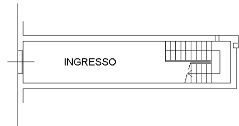
PIANO TERRA H = mt 3,00