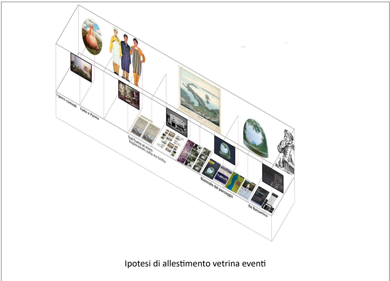
Ipotesi di allestimento vetrina eventi