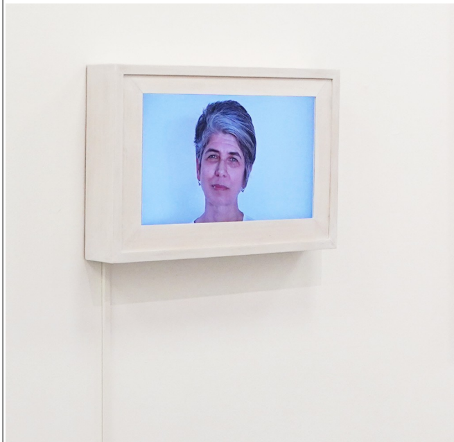
SCATOLA FAC SIMILE (da fare in MDF) per ogni monitor

Rimozione di vetro antiscalfatura dimensione 2x2 metri (profilo in metallo in basso e coprifilo in legno da togliere per aprire la vetrina e poi rimettere e ritinteggiare)