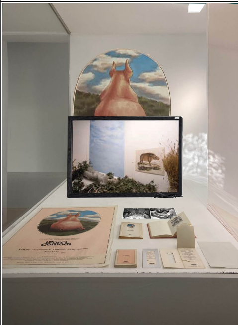
Zoom su primo box