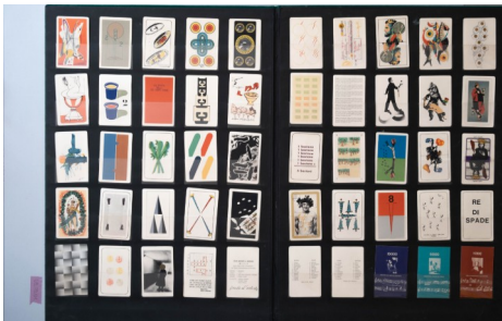
Libro Carte da gioco 70x100