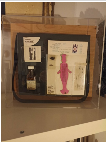
Valigia del migrante grande circa 50x60 da collocare su una mensola (il plexiglass c'è già)