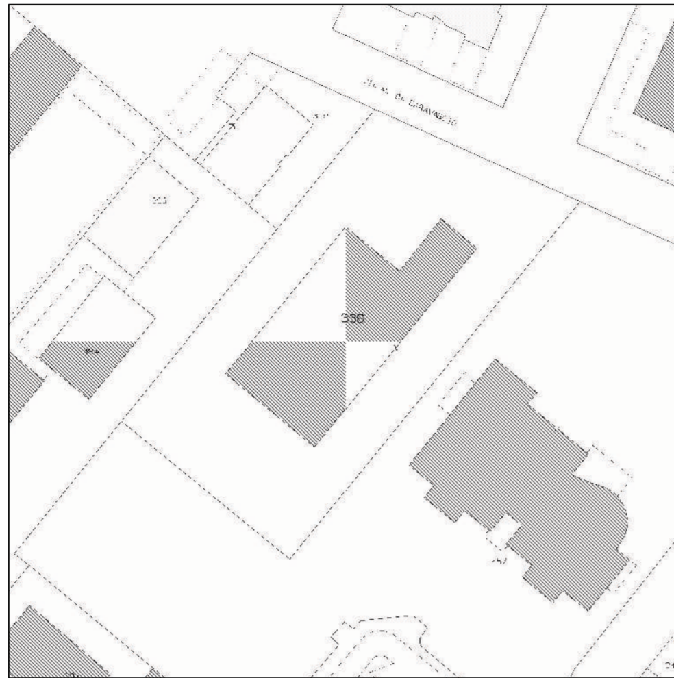
ESTRATTO CATASTALE foglio 174 mappale 336, comune RE scale 1:1000