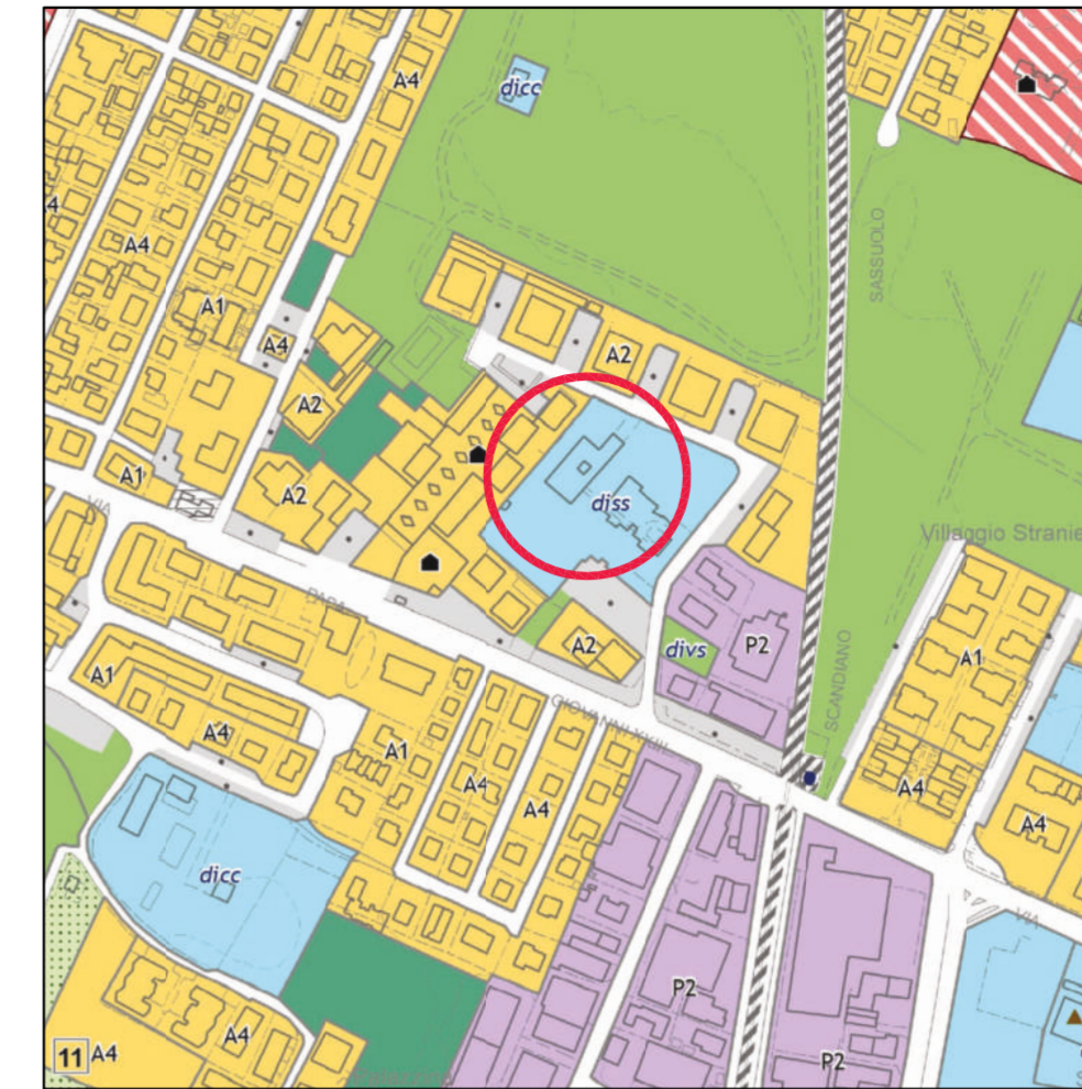
ESTRATTO PUG strategia per la qualità urbana ed ecologico-ambientale riquadro 23, comune RE scale 1:5000