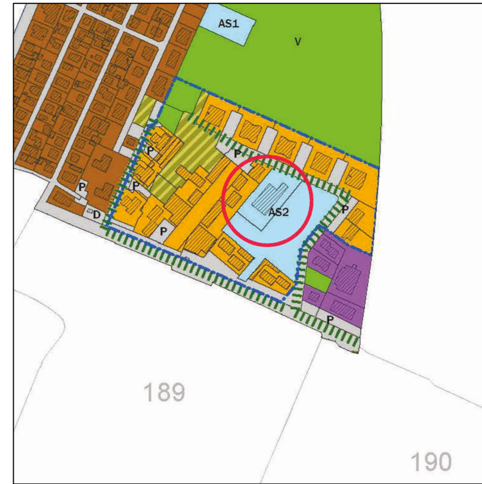
ESTRATTO RUE foglio 174, comune RE scale 1:5000