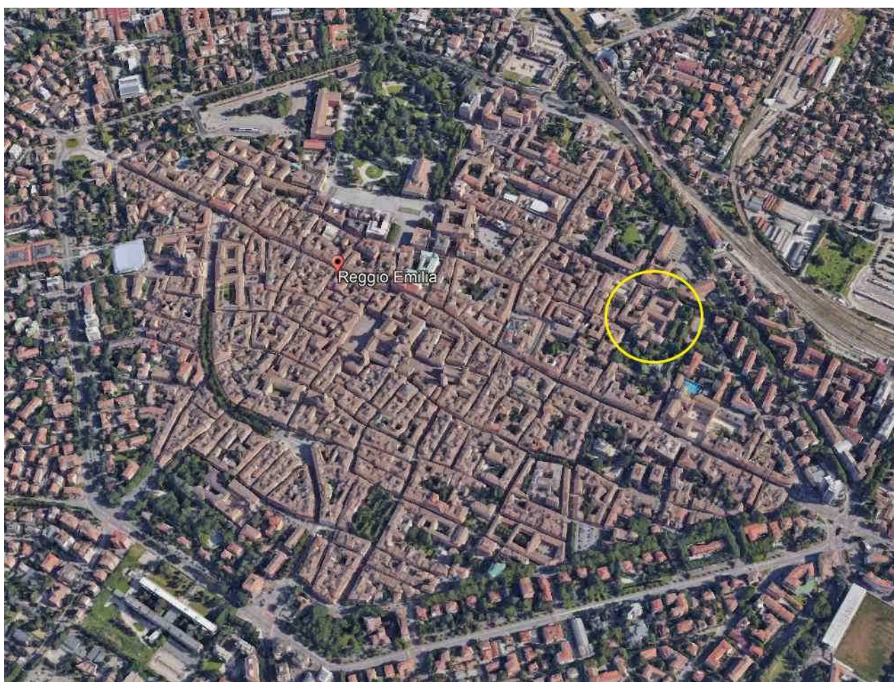
Centro Storico della città - zona Chiostri di S. Domenico