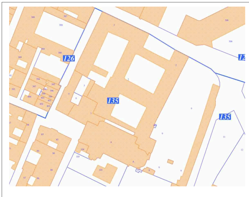
Stralcio Mappa Catastale - Foglio 135, Mappale 2