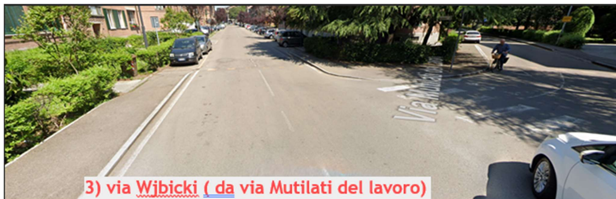
3) via Wjbicki ( da via Mutilati del lavoro )