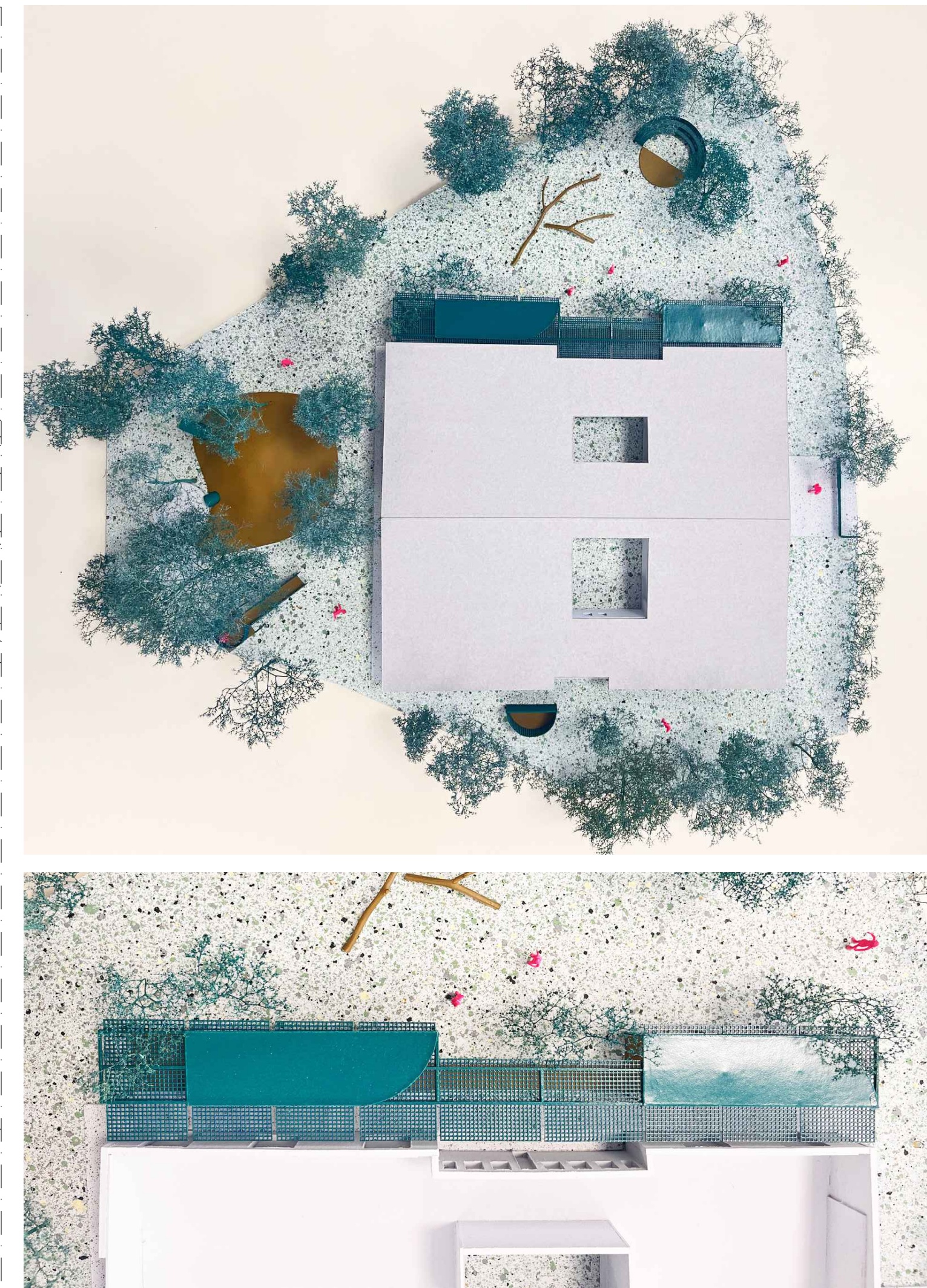
DETT. 1 - NUOVA RECINZIONE scale 1:20