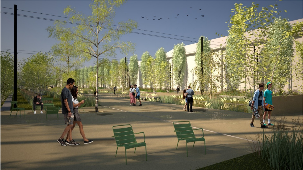
Figura 4 – Render di progetto su una delle zone di sosta lungo il percorso.

percorsi secondari di attraversamento trasversale. Questi si allargano spesso in prossimità del limite esterno individuando spazi dello “stare” di varie dimensioni attrezzati con arredi e attrezzature per la sosta, lo svago e lo sport. Lo spazio tra le zone dove insistono le funzioni sportive, posto ad est del percorso principale, è trattato come un’ampia piazza alberata con pavimentazione in ghiaia e la predisposizione di attrezzature per il gioco dei bambini.