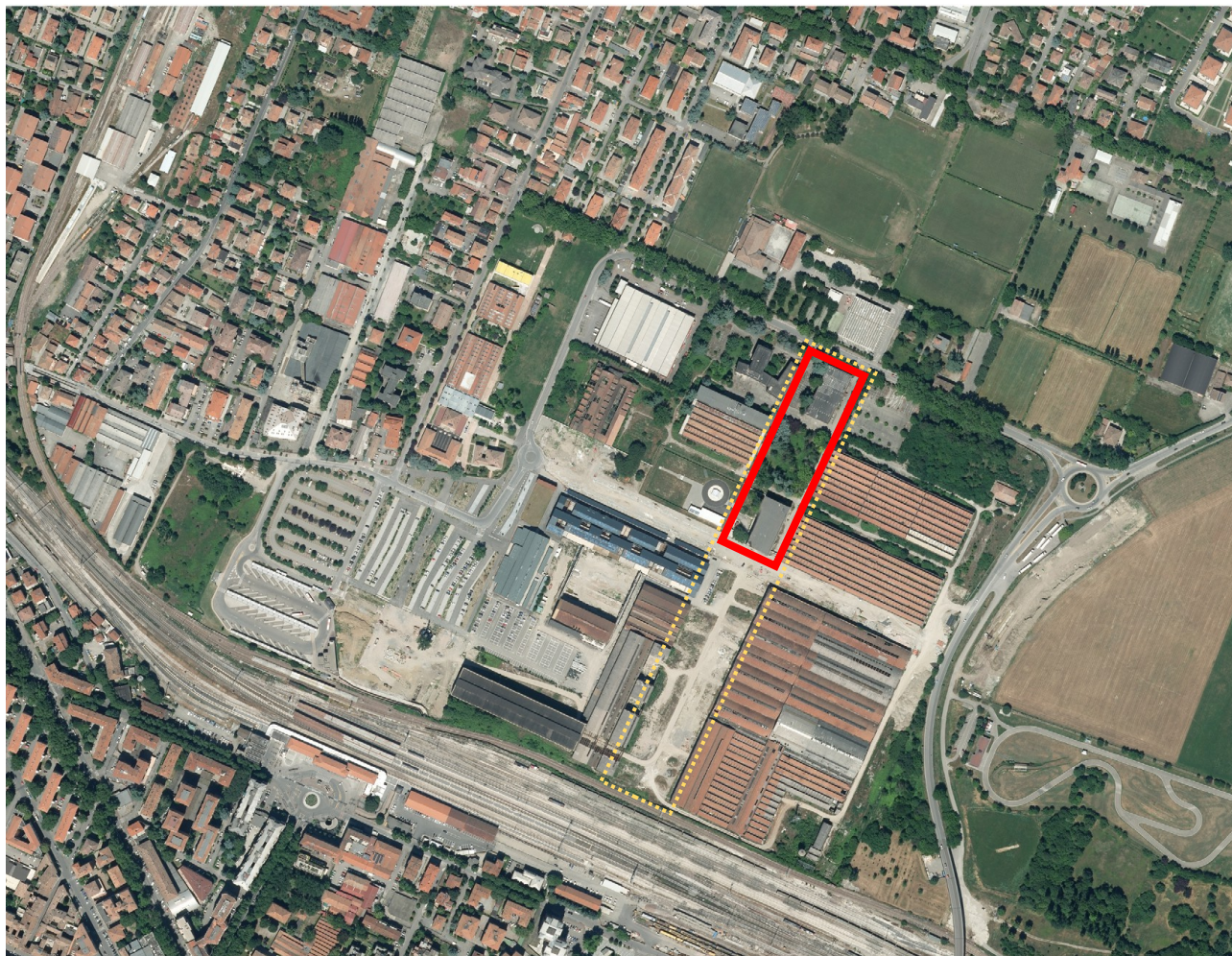
Figura 1 – Individuazione dell'area oggetto del PFTE (in rosso) nell'ambito del perimetro complessivo della Rambla (in giallo).

Il presente PFTE riguarda la realizzazione del tratto nord (dalla Viale Ramazzini a via Agosti) della cosiddetta Rambla: uno nuovo parco pubblico a servizio dei comparti rigenerati e in fase di riqualificazione delle ex Aree Reggiane a Reggio Emilia.