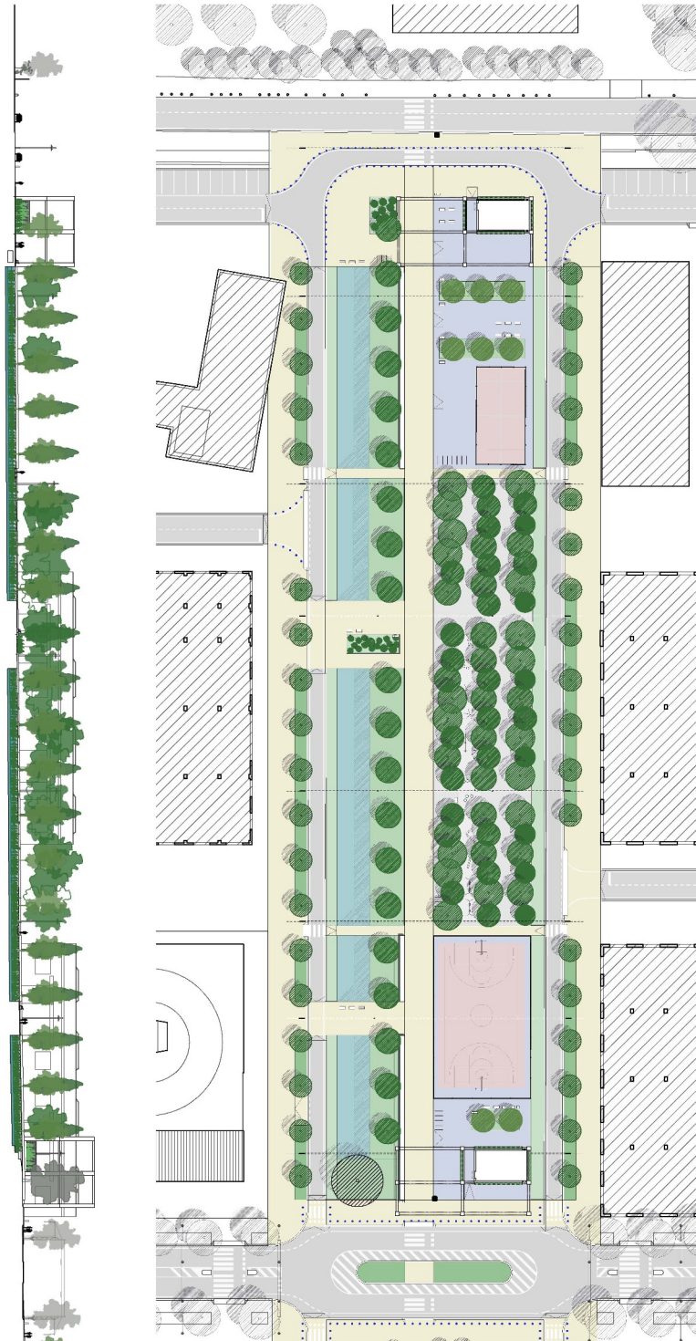
Figura 2 – Planimetria generale di progetto.

industriale dell'area come forma di memoria attiva nella fruizione estetica dello spazio pubblico. Infatti, la necessaria bonifica dell'area, come accennato, comporterà una parziale demolizione dei capannoni esistenti nell'area di cui rimarrà traccia del sedime, recuperato per spazi sportivi e di svago, e della struttura, il cui scheletro sarà in parte mantenuto come elemento della memoria e supporto per locali tecnici e attrezzature.