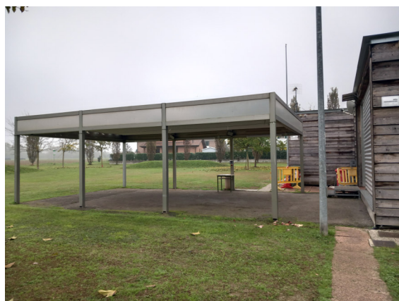
Struttura con copertura mobile