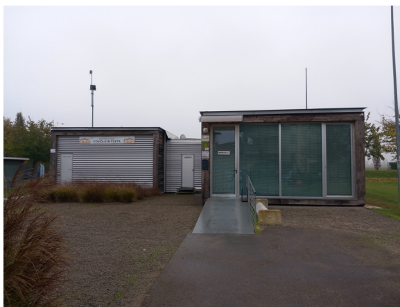
Ingresso da Via F.lli Rosselli